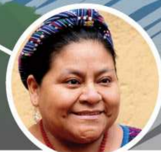
RIGOBERTA MENCHÚ Embajadora de la UNESCO y ganadora del Premio Nobel de la Paz. UNESCOko Enbaxadore eta Bakearen Nobel Sariduna (1992)