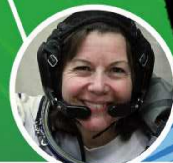
VALENTINA TERESHKOVA Cosmonauta rusa. Primera mujer en viajar al espacio. Kosmonauta errusiarra. Espazioara bidaiatu duen lehen emakumea