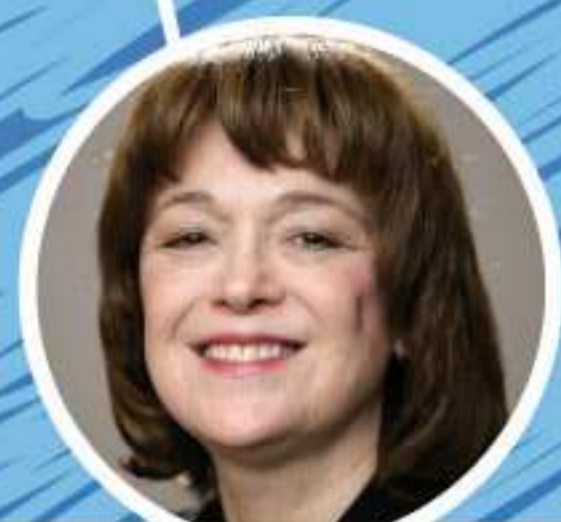
LINDA BUCK Ganadora del Premio Nobel de Fisiología o Medicina. Fisiología eko Medikuntzan Nobel Sariduna (2004)