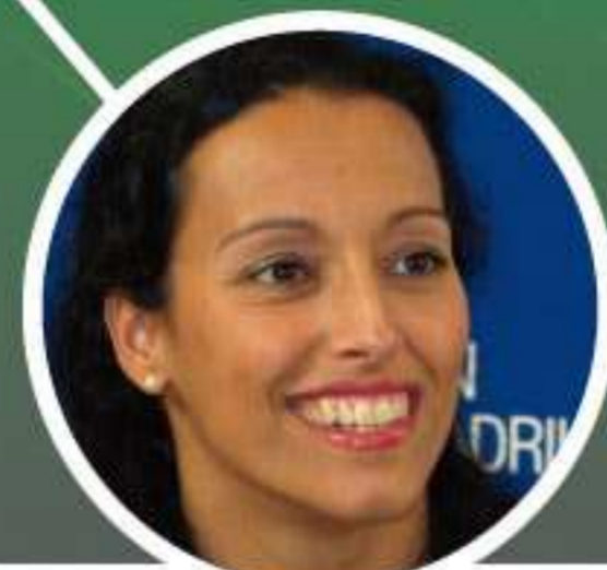
TERESA PERALES Ganadora de 22 medallas en Juegos Paraolímpicos. Paralinpiar Jokoetan 22 dominen irabazlea