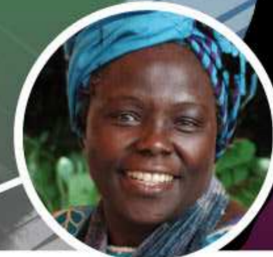
WANGARI MAATHAI Ganadora del Premio Nobel de la Paz. Bakearen Nobel Sariduna (2004)