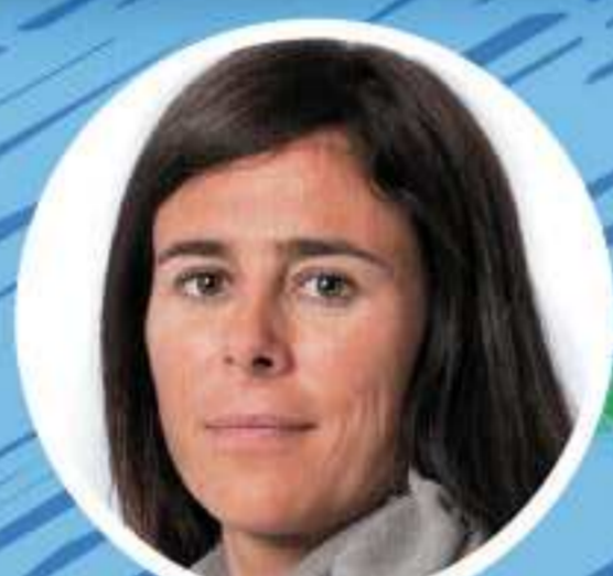
EDURNE PASABAN Primera mujer en ascender los 14 ochomiles. 14 zortzimilakoak igo dituen lehen emakumea