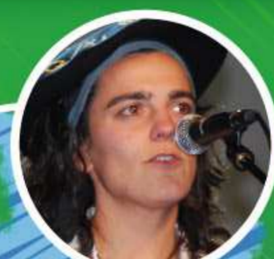
MAIALEN LUJANBIO Campeona Nacional de Bertsolaris. Bertsolari Txapelketa Nagusiko txapelduna (2009)