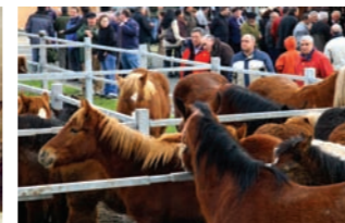
Ferías de Tafalla