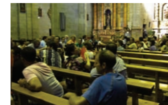
Visita guiada a la iglesia de San Miguel Arcángel de Larraga

A mediados de septiembre se organizarán dos visitas guiadas a todos los monumentos que integran la ruta. Estarán dirigidas a los colectivos locales (asociaciones de mujeres, jubilados, etc.) y previamente se informará sobre ello.