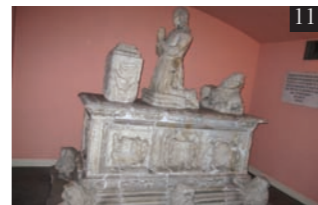
Sepulcro de los condes de Lerín. Palacio de Lina, Madrid (F. J. Virto)