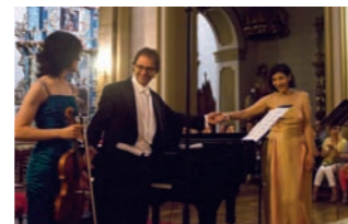
Festival Internacional de Música de Mendigorriá

En los conciertos del 1 y 8 habrá visita guiada a la iglesia a las 18:30 h. Más información en www.festivalmendigorria.com