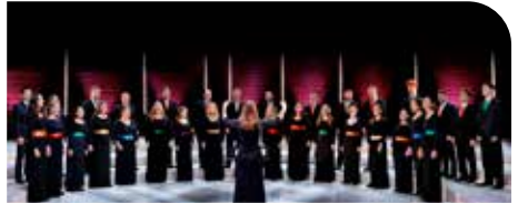
NEW DUBLIN VOICES (Irlanda).