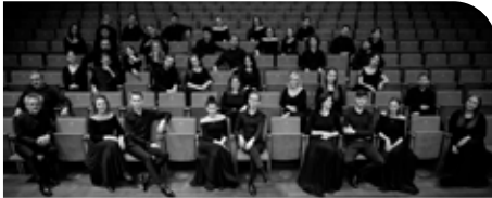
PADEREWSKI CHAMBER CHOIR (Polonia).