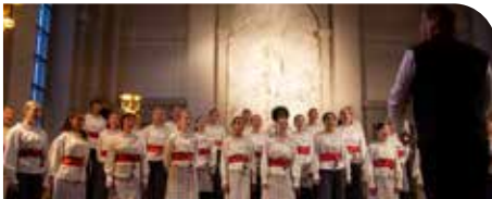
ADOLF FREDRIK'S GIRLS CHOIR (Suecia).